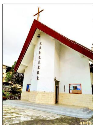
有 148 年歷史的愛蘭教會外觀。

埔里鎮愛蘭教會已有一百四十八年歷史，是鎮內最老的教會，最近南投縣文化資產學會理事長梁志忠到該教會進行宗教普查，發現教會悉心保存文物，而這些文物極其珍貴，讓梁志忠對教會的用心讚嘆不已。