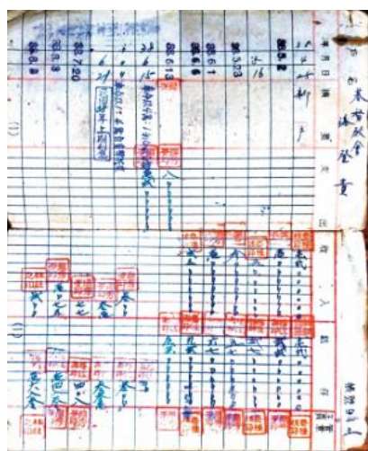
愛蘭教會的存摺從十二萬變三元見證新舊台幣歷史。