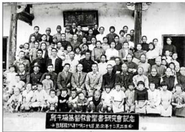
愛蘭教會在日治時期是使用聚落的建物當禮拜堂。