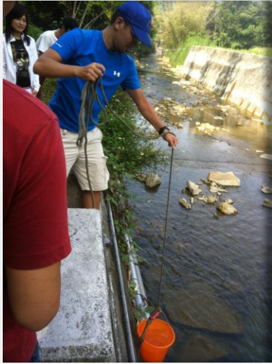
水質分析課程於桃米坑溪上游進行採樣