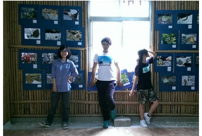
暨大學生的蝴蝶攝影牆

人社中心主動盤點部落閒置空間，在獲得社區發展協會同意後，以協會辦公室二樓作為「眉溪 X 暨大協作據點」。我們以此作為暨大外展(outreach)教室，透過教學讓學生貼近部落，親身感受在地實務。在暨大學生與部落居民的協力下，據點空間逐步完成布置工作。目前據點除了暨大師生使用外，部落居民也會主動利用，活絡整體空間氛圍。