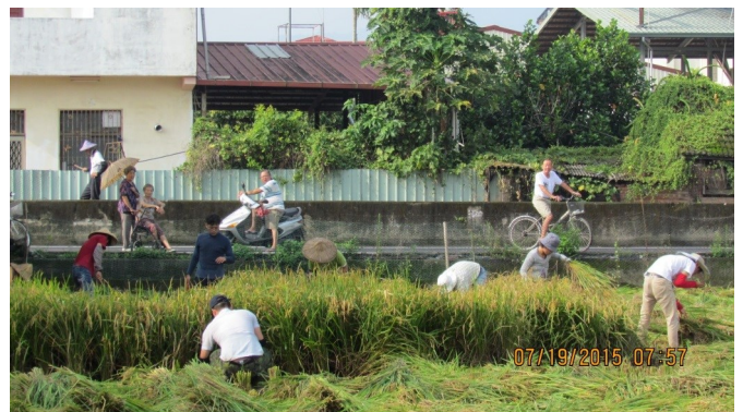
籃城公田第一期稻收割

今年三月我們組了一團九人共耕隊，和籃城社區發展協會「合穀」，各負擔 50% 的耕作成本與耕作勞動力（包含人力、工具和技術），在一分三大的田地種植稻米。在一般人看起來，我們這樣做非常不符合經濟效益，但我們看到的價值並不在於金錢收益的多寡，而是這個社區浮現出一種共同生產模式，能產出社區的「共有財」（Commons）。自插秧起到收割後的白米加工，社區退休的老農與還在為生計打拼的農民不僅提供種稻技術、勞力和經驗，也不吝適時出借私人工具。沒有實際動手的居民，給予參與農務的年輕人支持與鼓勵，也同時關心公田的狀況，協助守護稻子的生長。