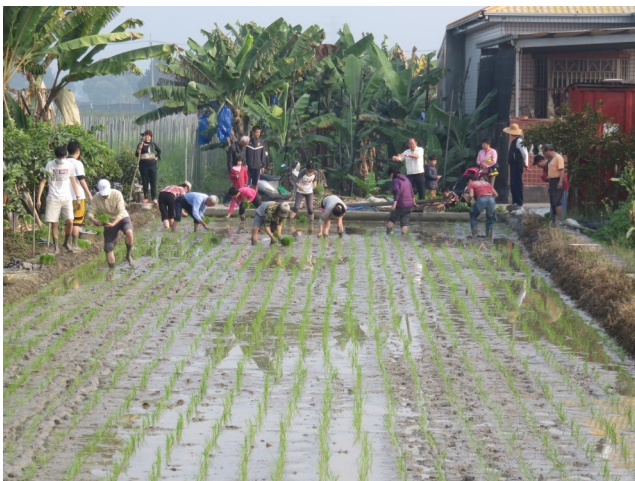
籃城公田第一期插秧

2013 年起開始有暨大職員生以籃城社區為工作和生活的基地，包括籃城好生活團隊、籃城書房、四分之三團隊和暨大人社中心等，這些「新住民」和這個傳統社區開始有互動和協作。今年（2015 年）我們在這個社區推了「公田」與「社區公共菜園」兩個實驗計畫，即結合這些在地「新住民」、暨大師生與在地社區。