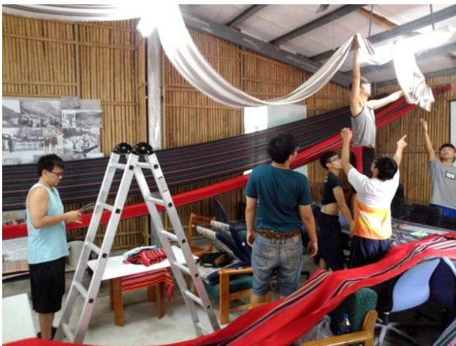
部落青年參與據點布置