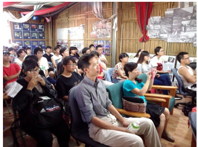
103學年度第二學期眉溪課程共同 成果發表