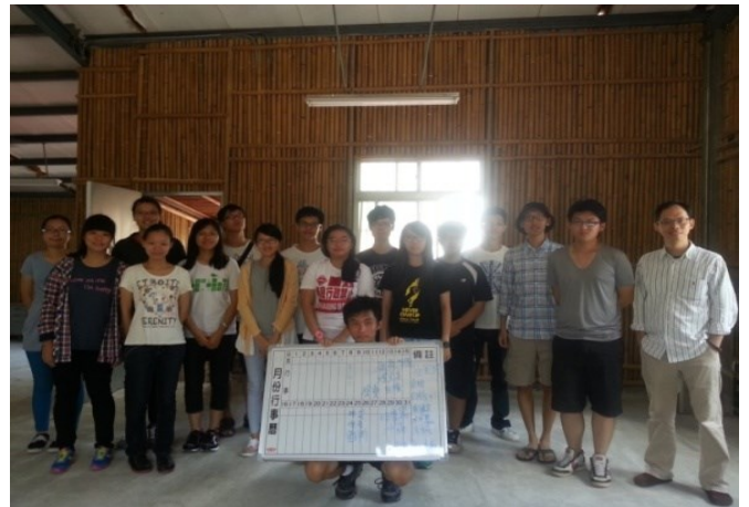
暨大生討論據點空間優缺點與未來想像