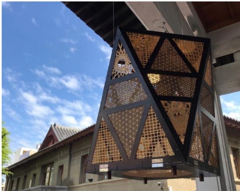
南投竹藝博覽展出竹編天燈裝置藝術。(南投縣文化局提供)