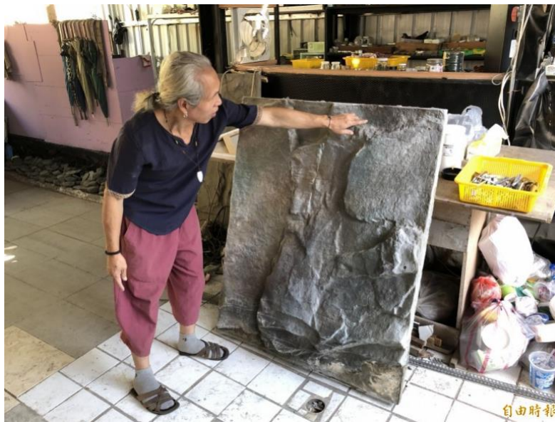
勤燕壁尋訪真實的山壁，再將想要的山壁拓印複製進行創作，十分獨特。