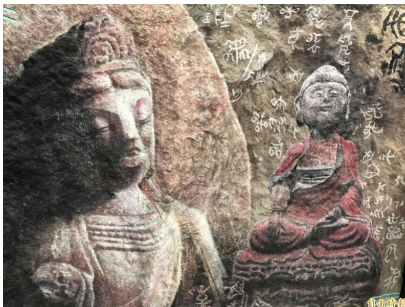
勤燕壁複製的山壁，也依據原有的紋路、凹凸起伏進行創作彩繪。（記者佟振國攝）