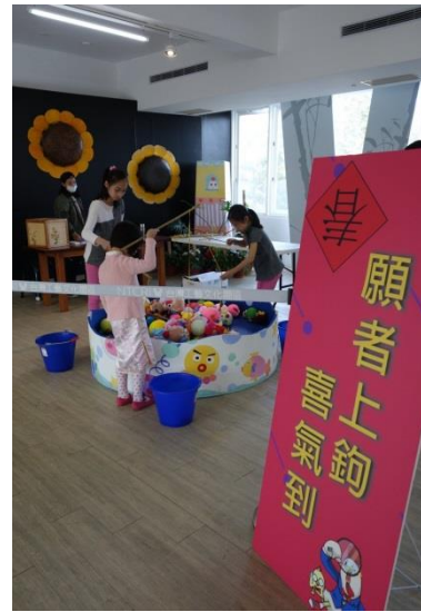
工藝中心將各項工藝元素注入雞年主題，願者上鉤喜氣到釣出福運。