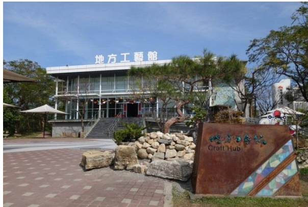
工藝中心將各項工藝元素注入雞年主題，還有美麗景致可以漫遊拍攝。